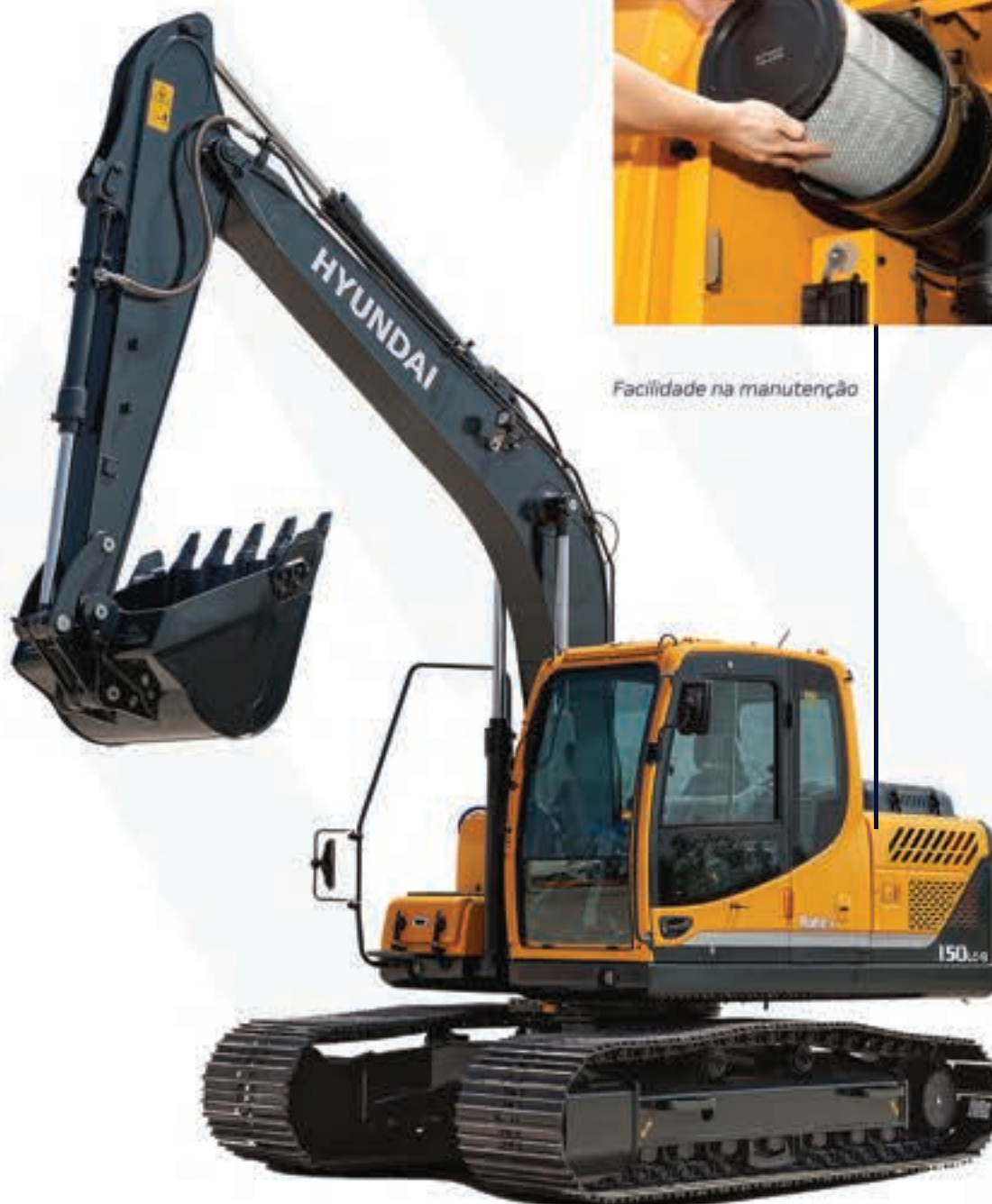
Facilidade na manutenção

Os chassis superior e inferior são compostos por aços e soldas de alta resistência formando uma estrutura de alta estabilidade e durabilidade. A integridade estrutural foi testada através da análise FEM (Método de Elementos Finitos) em testes de durabilidade de longa duração.